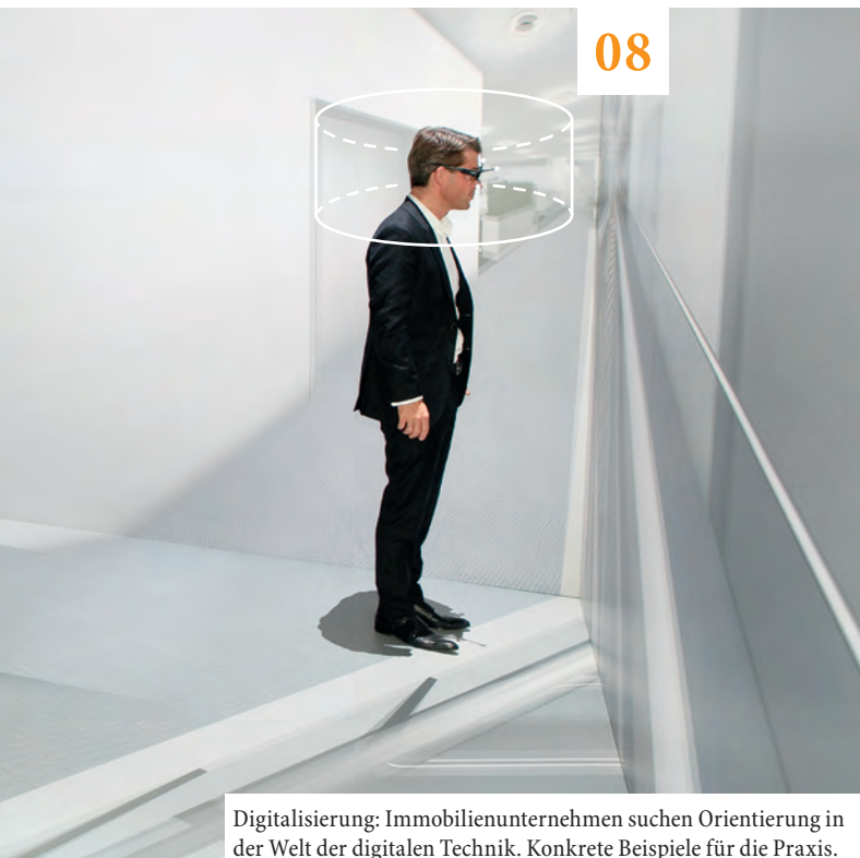
08 Digitalisierung: Immobilienunternehmen suchen Orientierung in der Welt der digitalen Technik. Konkrete Beispiele für die Praxis.