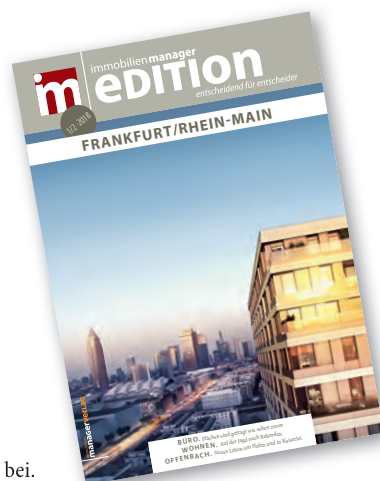
Dieser Ausgabe liegt die Edition Frankfurt/Rhein-Main bei.