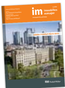
Dieser Ausgabe von immobilienmanager liegt die Edition Frankfurt/Rhein-Main bei.